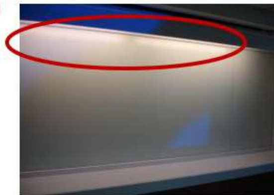
元璋玻璃的白板玻璃 無眩光，保護眼睛