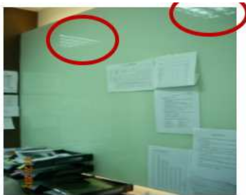
其他廠商的白板玻璃 會產生眩光

利用 AG 防眩光白板玻璃牆壁設計主管辦公室或是會議室，不但兼具室內設計美感，亦具會議教室功能，一舉數得。